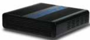
BeeBox classic **